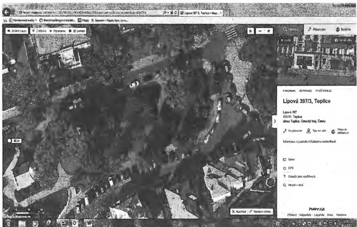
Lokalita park Seume – zeleň v poslední části parku (směrem k Obchodní akademii) – kruhový záhon v prostoru (průměr kruhu 5 m) – „Equilibre“: osázená plocha kruhu 20 m 2