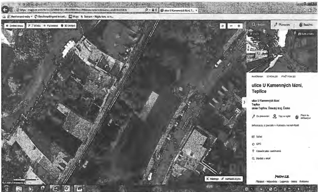
Lokalita šanovský park – U Kamenných lázní – pod hřištěm na pétanque – osázet „delší stranu hřiště“ – „Sec“: nechat 1 běžný metr trávy, vytvořit metrový záhon – osázená plocha 60 m 2