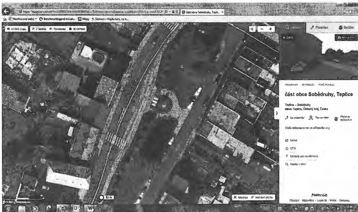
Lokalita náměstí Sobědruhy – kruhová zeleň vprostřed náměstí - 1 běžný metr nechat trávu po obvodu – „Equilibre“: osázená plocha 40 m 2