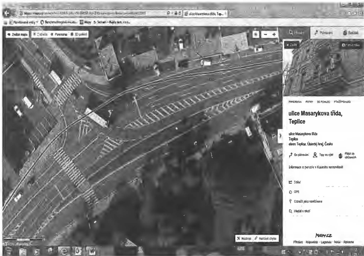
Lokalita Masarykova tř. (u PČR) – celá zeleň mezi komunikacemi (zkusíme to od obruby k obrubě) – „Sec“: osázená plocha 250 m 2