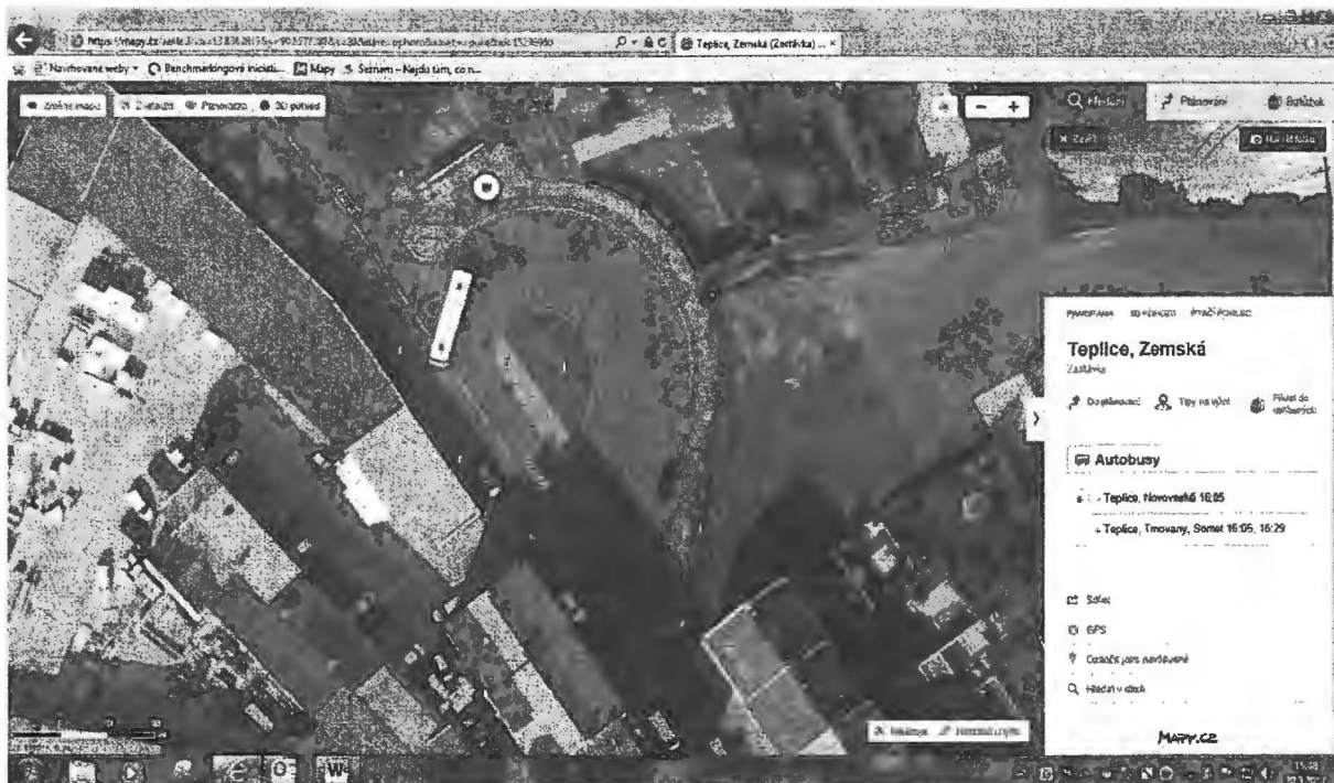
Lokalita Zemská – zeleň na točně - 1 běžný metr nechat trávu po obvodu – „Equilibre“: osázená plocha 50 m 2