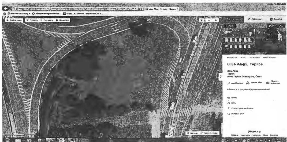
Lokalita Dubská – Alejní - 1 běžný metr nechat trávu od silnice – „Sec“ – vytvořit metrový záhon „od silnice k chodníku pod viadukt“ (délka 70 m) - osázená plocha 70 m 2