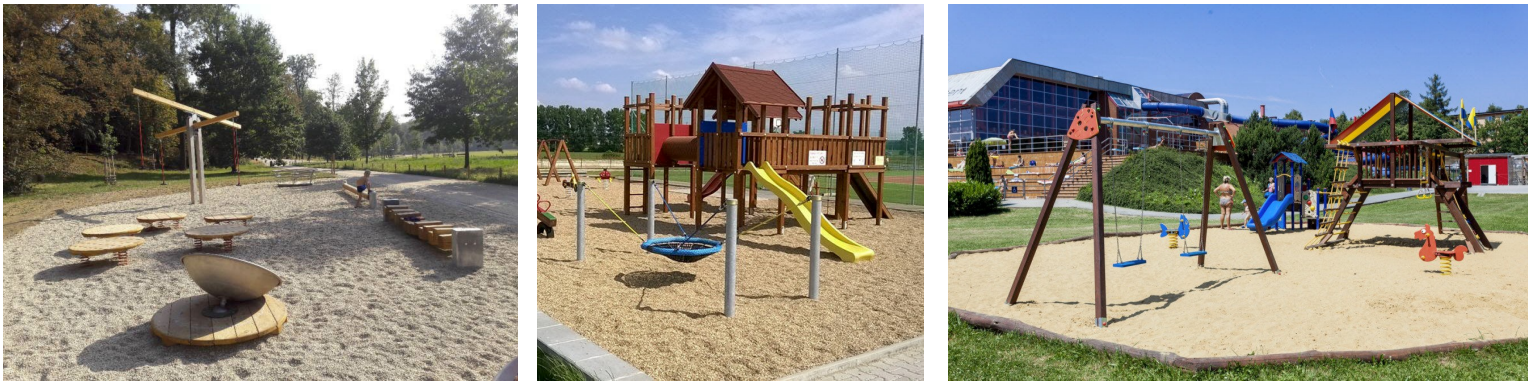
fotografie jsou ilustrační