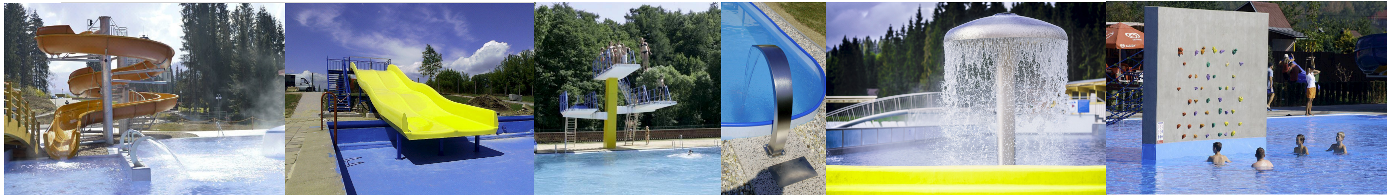
VODNÍ TOBOGÁN 1